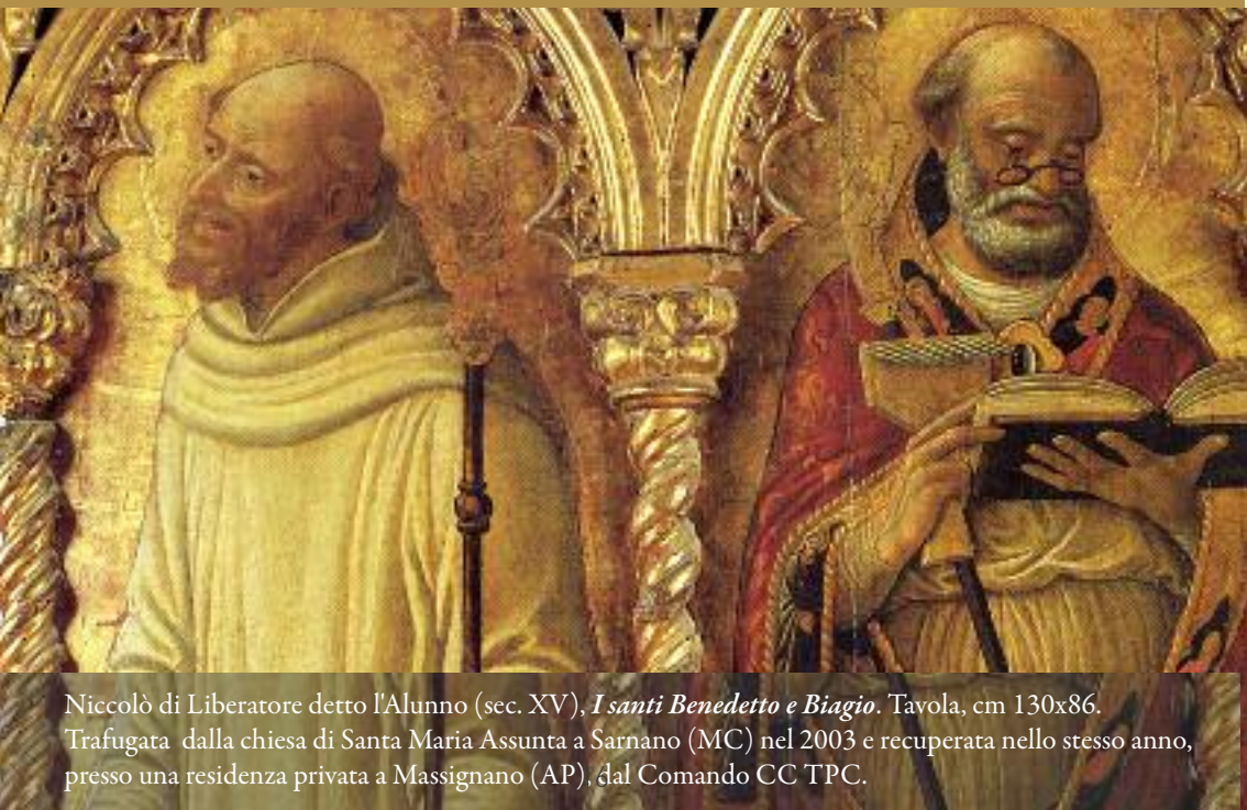
Niccolò di Liberatore detto l'Alunno (sec. XV), I santi Benedetto e Biagio . Tavola, cm 130x86. Trafugata dalla chiesa di Santa Maria Assunta a Sarnano (MC) nel 2003 e recuperata nello stesso anno, presso una residenza privata a Massignano (AP), dal Comando CC TPC.