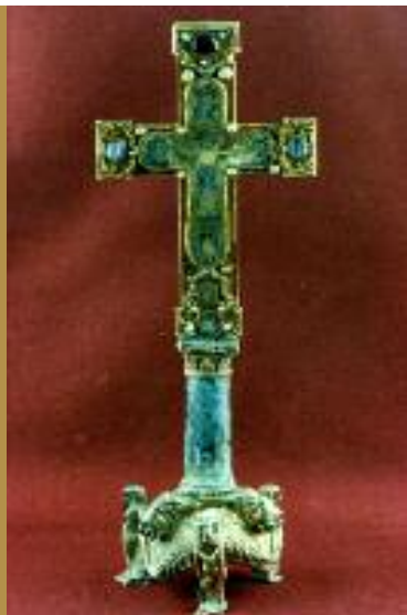
Croce Veliterna, cm 20x12 Trafugata dal Museo della Cattedrale di San Clemente di Velletri (RM) nel 1983, recuperata nel 1995, presso una residenza privata a Rimini, dal Comando CC TPC.

Queste, unitamente ai dati dell'evento delittuoso, permettono alla Forza di Polizia interessata alla ricezione, di compilare le "Schede Evento TPC" e inviarle al Comando CC TPC