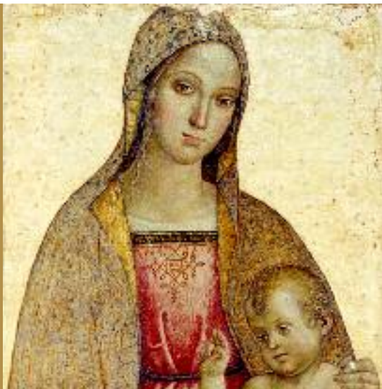
Andrea Aloigi detto "l'Ingegno" (sec. XVI) Madonna col Bambino . Tempera su tavola, cm 115 x 66. Trafugata dalla Chiesa di Santa Maria Maggiore di Spello (PG) e recuperata nel 2004, presso una Casa d'Aste a Monaco di Baviera, dal Comando CC TPC.