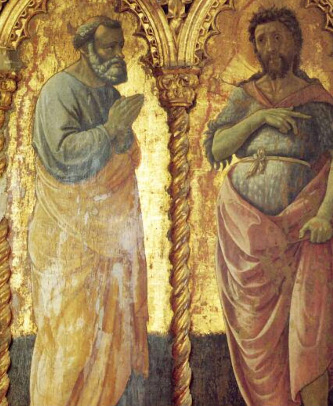
Niccolò di Liberatore detto l'Alunno (sec. XV), I santi Pietro e Giovanni . Tavola, cm 130x86. Trafugata dalla chiesa di Santa Maria Assunta a Sarnano (MC) nel 2003 e recuperata nello stesso anno in una residenza privata a Massignano (AP), dal Comando CC TPC.