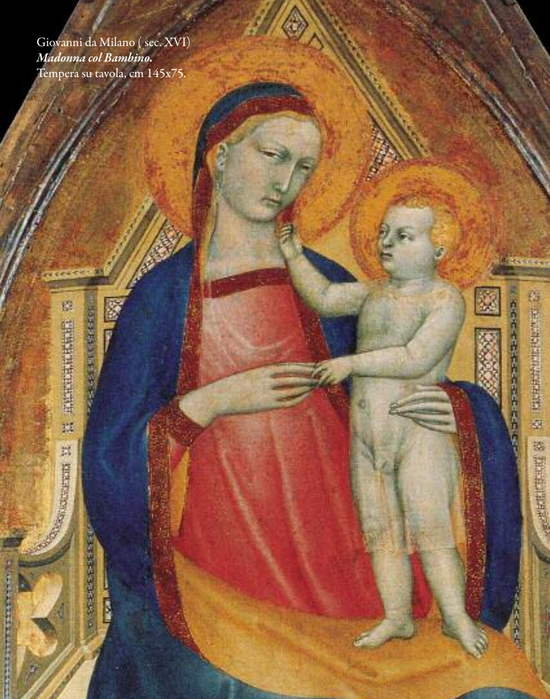
Giovanni da Milano (sec. XVI) Madonna col Bambino. Tempera su tavola, cm 145x75.

Trafugato dalla chiesa di San Bartolo in Tuto di Scandicci (FI) nel 1977 e recuperato nel 1981; in una residenza privata a Milano, dal Comando CC TPC.