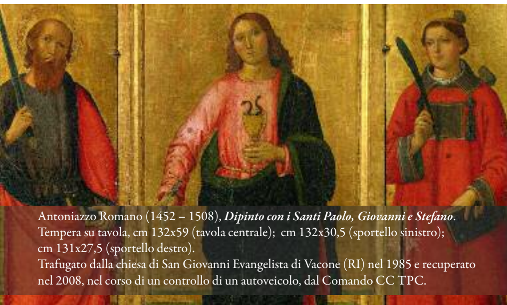
Antoniazzo Romano (1452 – 1508), Dipinto con i Santi Paolo, Giovanni e Stefano .

Il permesso dell'Ordinario e il coordinamento degli Uffici sono necessari anche nel caso di prestiti di beni culturali ecclesiastici per mostre o eventi espositivi di carattere nazionale. A tal proposito, si deve esigere dagli organizzatori degli eventi che le didascalie delle opere esposte (o nei cataloghi o nelle pubblicazioni) riportino anche la provenienza e la proprietà, ritenute utili nel caso in cui i beni, qualora sottratti e individuati, debbano essere "rivendicati".