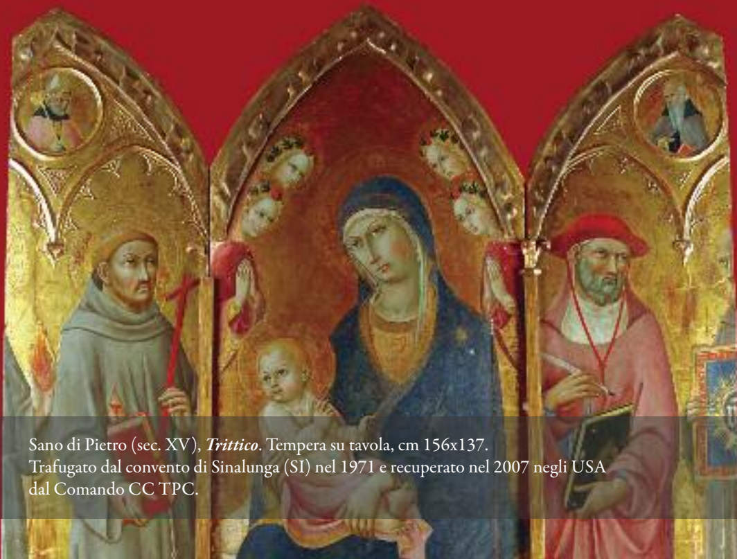
Sano di Pietro (sec. XV), Trittico . Tempera su tavola, cm 156x137.

L'esito di questo lavoro è consultabile online attraverso il portale BeWeb – Beni ecclesiastici in Web, all'indirizzo www.chiesacattolica.it/beweb .