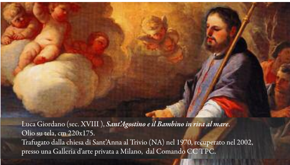
Luca Giordano (sec. XVIII), Sant'Agostino e il Bambino in riva al mare .

È opportuno, inoltre, che la centralina dell'impianto (posizionata in un luogo protetto) segnali quale dei sensori abbia fatto scattare l'allarme. Ciò è importante per la temporanea esclusione del sensore in avaria (senza disabilitare il sistema, il cui ripristino dovrà comunque avvenire appena possibile) e per disporre, in caso di furto, di maggiori informazioni.